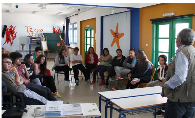
Εισαγωγική συζήτηση μαζί με τους 17 μαθητές του Γυμνασίου και Α Λυκείου Λειψών.