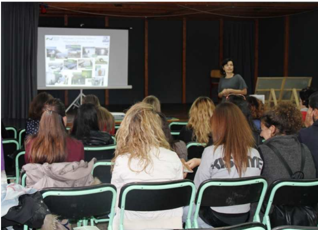
Σεμινάριο Εκπαιδευτικών, 07/04/2014, ΔΣ Σκάλας Πάτμου.

Συνολικά, 71 εκπαιδευτικοί (νηπιαγωγοί, δάσκαλοι και καθηγητές) παρακολούθησαν τις ενημερώσεις και το Σεμινάριο φέτος.