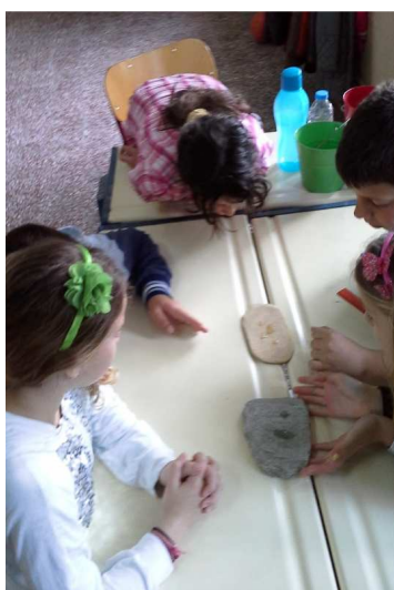
Οι μαθητές ελέγχουν την διαπερατότητα των υλικών σε νερό, και προτείνουν ποια είναι κατάλληλα για να κατασκευάσουν μια στέρνα. Εφαρμογή στο Δ.Σ. Κάμπου Πάτμου.