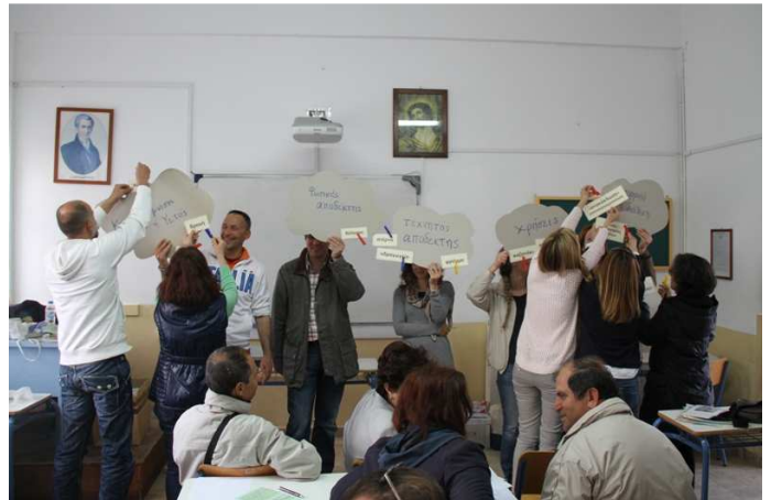
Σεμινάριο Εκπαιδευτικών, 10/04/2014 1 ο Γ/σιο Λέρου.