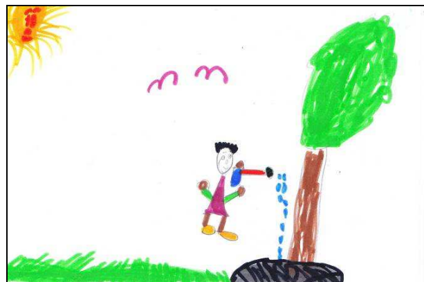
Ποτίζουμε με ποτιστήρι ... Δ.Σ. Λειψών, Τάξη Β