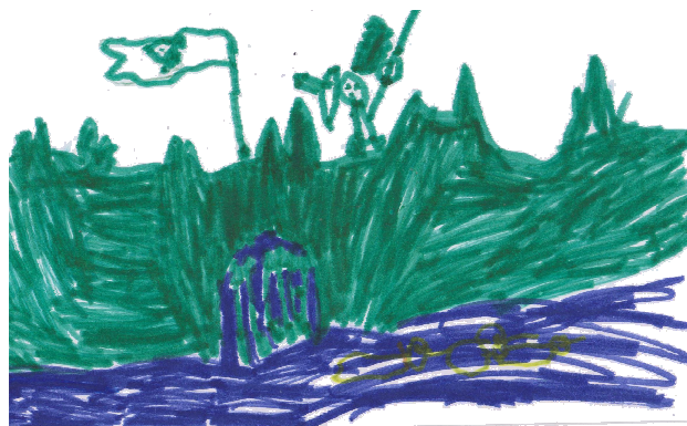
Πολεμιστές του κάστρου φυλάνε το νερό ... Δ.Σ. Χώρας Πάτμου, Τάξη Α

Οι αξιολογήσεις των εκπαιδευτικών που παρακολούθησαν το πρόγραμμα ήταν πολύ θετικές. Και φέτος αρκετοί εκπαιδευτικοί έδωσαν ωραίες ιδέες για βελτίωση του προγράμματος σε επόμενη εφαρμογή.