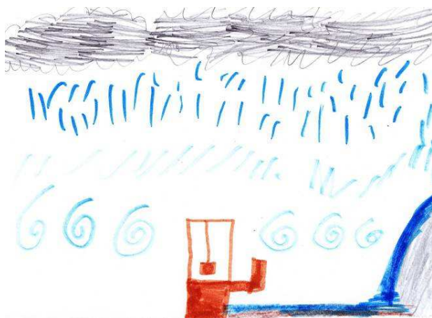
Εξάτμιση – σύννεφα – βροχή - ρυάκι κ ένα πηγάδι ... Δ.Σ. Σκάλας Πάτμου, Τάξη Β