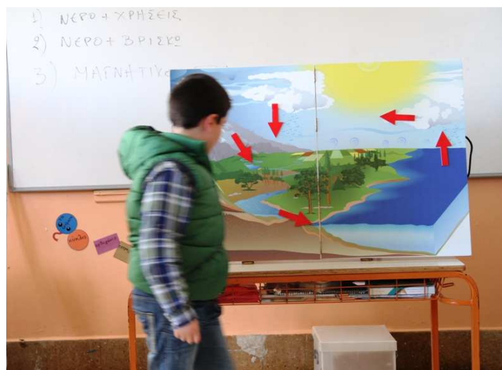
Οι μαθητές βρίσκουν τον κύκλο του νερού σε μαγνητικό πίνακα πολύ ενδιαφέρουσα δραστηριότητα σύμφωνα με την αξιολόγηση. Εφαρμογή στο Δ.Σ. Λακκίου Λέρου.